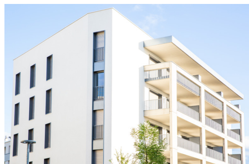
1 ère résidence intergénérationnelle Alabama à Lyon 8 ème 22 logements LLS