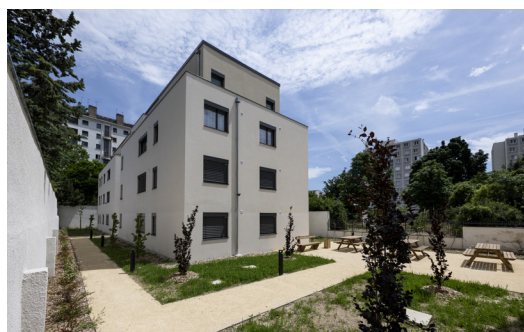
Résidence Confiance à Lyon 8 ème 47 logements étudiants et jeunes actifs

« Alliade Habitat accompagne ses locataires à chaque étape du parcours de vie en produisant des logements adaptés aux besoins des habitants et des territoires. » »