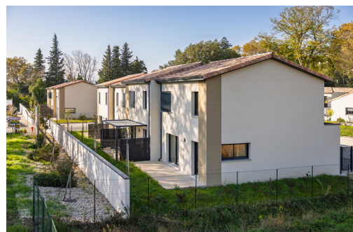
Résidence Le Domaine de Géry à Montélimar (26) 6 logements individuels - VEFA Rampa Réalisation