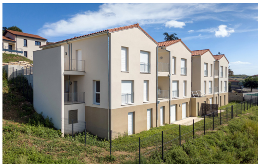
Résidence Les Hespérides à Saint-Romain-en-Jarez (42) 10 logements collectifs - MOD

« Alliade Habitat accompagne ses locataires à chaque étape du parcours de vie en produisant des logements adaptés aux besoins des habitants et des territoires. » »